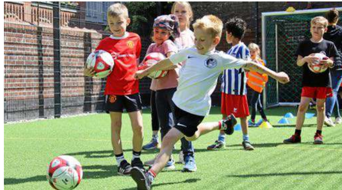
Bei den Aktionstagen können Kinder unterschiedliche Sportarten ausprobieren. JUERGEN ENGLER

ganisationen, mit denen wir kooperieren, sodass wir auf etwa zehn Stände und Parcours kommen. Dazu gesellen sich teilweise ortsansässige Vereine oder die Schulen stellen selbst etwas auf die Beine“, erläutert Pietsch.