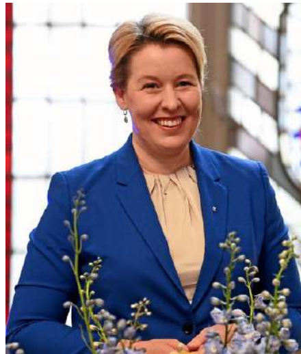
Franziska Giffey ist seit Dezember 2021 Regierungschefin des Landes Berlin.

Franziska Giffey Regierende Bürgermeisterin von Berlin