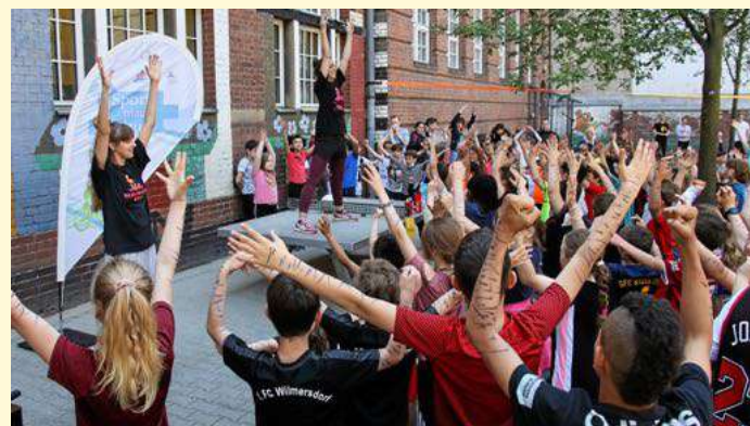
Kooperation mit Vereinen: Die Sport-Aktionstage von „Sport macht Schule“. JUERGEN ENGLER

VBKI gGmbH IBAN: DE88 1005 0000 0192 0212 22 BIC: BELADEXXXX