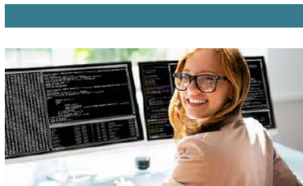
Fachkräftemangel im Digitalen: Informatikerinnen und Informatiker werden händeringend gesucht.