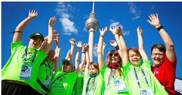
Die Vorfreude ist groß: Nächstes Jahr kommen 7000 Sportler nach Berlin.

Im kommenden Jahr finden die Special Olympics World Games in der Hauptstadt statt – die Vorbereitungen laufen bereits